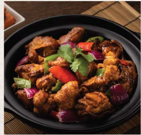
四川花椒辣雞煲 Sichuan Spicy Chicken

半隻 Half 澳門元 138 MOP 一隻 Whole 澳門元 218 MOP