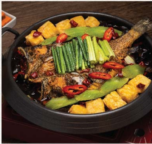
川味烤海斑 Sichuan Style Grouper Hot Pot