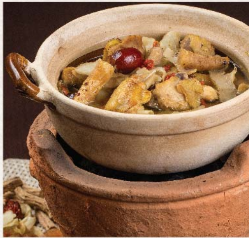
滋補雞煲 Chicken and Chinese Herbs Casserole

半隻 Half 澳門元 138 MOP 一隻 Whole 澳門元 218 MOP