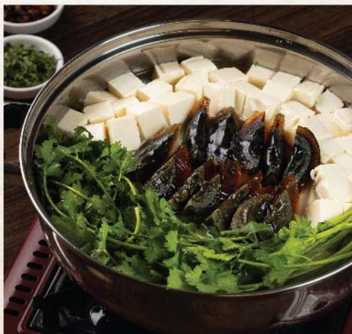
芫茜皮蛋鍋 Coriander, Tofu and Century Egg Hot Pot