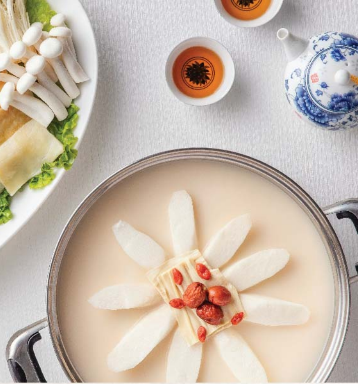
養顏花膠濃湯雞煲 Chicken and Fish Maw in Rich Broth