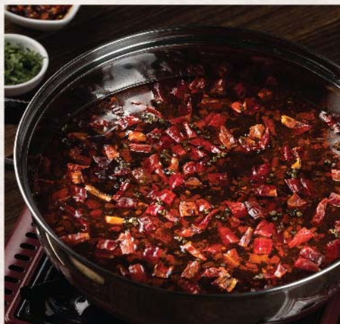
四川麻辣鍋 Sichuan Spicy Hot Pot