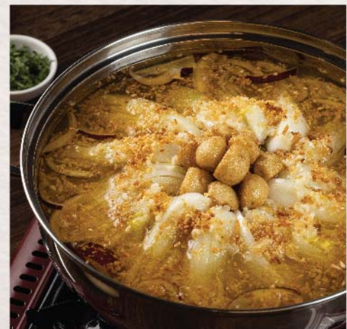
黃金蒜香鍋 Crispy Garlic Hot Pot