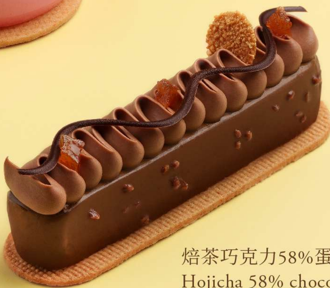
焙茶巧克力58%蛋糕 Hojicha 58% chocolate cake

所有价目以澳门元计算并需加收10%服务费及5%旅游稅。 All prices are in MOP and subject to a 10% service charge and a 5% tourism tax.