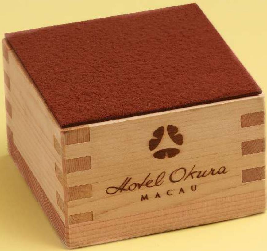
炭烧咖啡提拉米苏 Charcoal coffee tiramisu