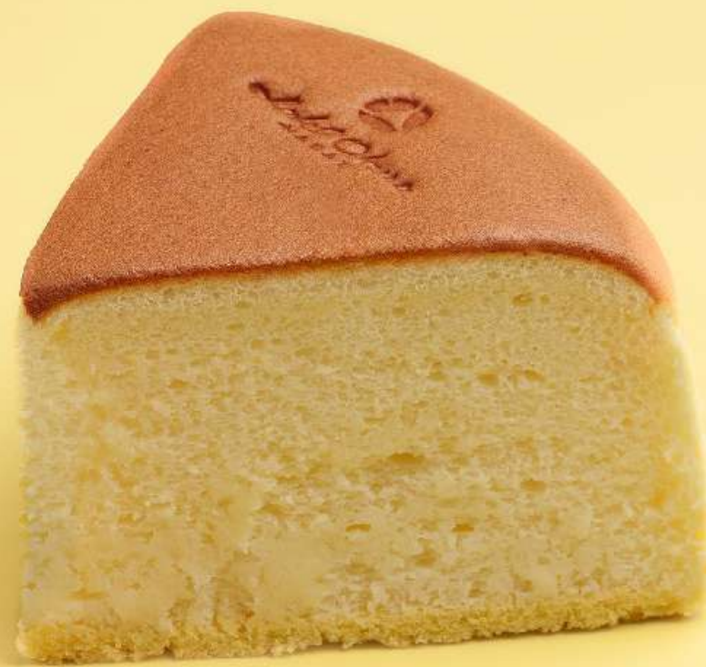
日式轻芝士蛋糕 Japanese soufflé cheesecake