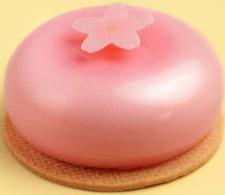
樱花樱桃蛋糕 Sakura cherry cake