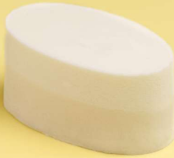
豆腐酸奶蛋糕 Tofu yogurt cake